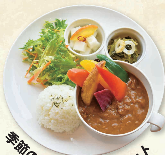
季節の野菜カレープレート ¥1,200