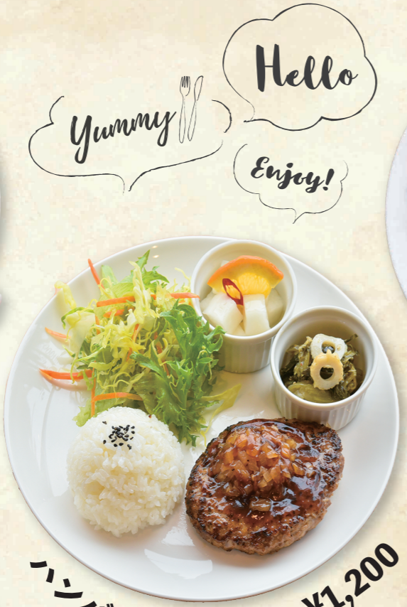
ハンバーグプレート ¥1,200