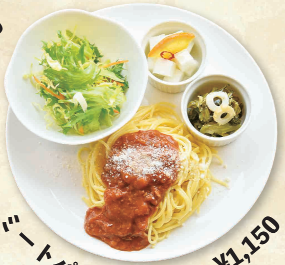
ミートパスタプレート ¥1,150

★ドリンクは下記より お選びください ■アップル ■オレンジ ■コーラ ■メロンソーダ ■アイスコーヒー